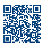
Video PRIMO XR